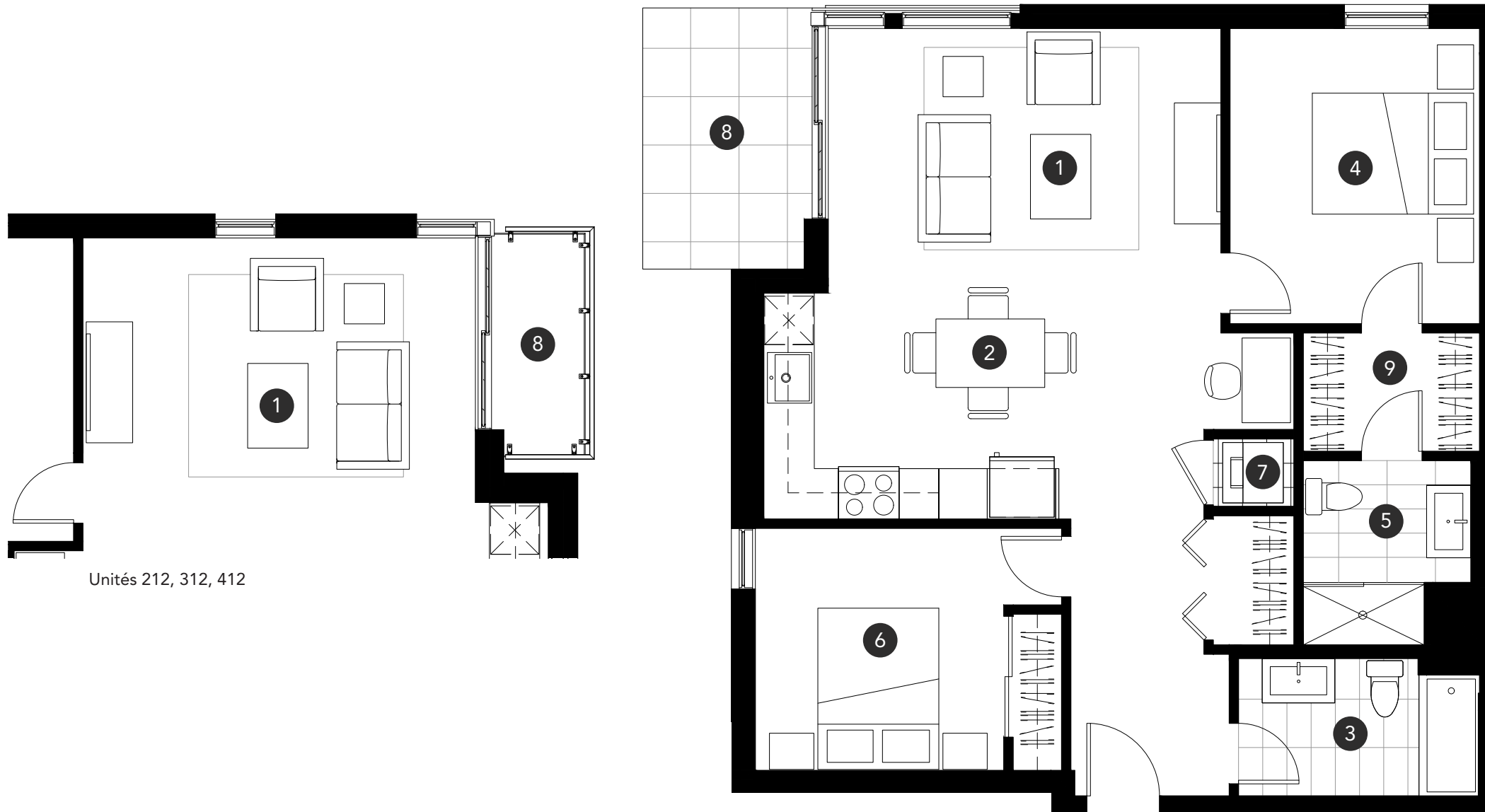
Unités 212, 312, 412