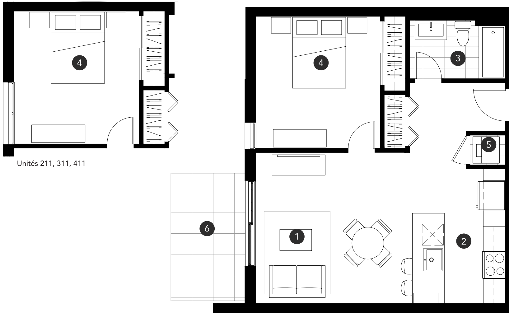
Unités 211, 311, 411